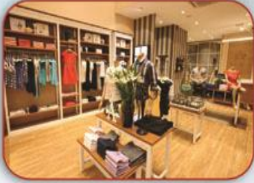
محلات ملابس Clothes Shops