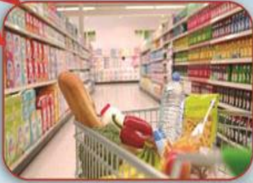
سوبر ماركت Supermarket